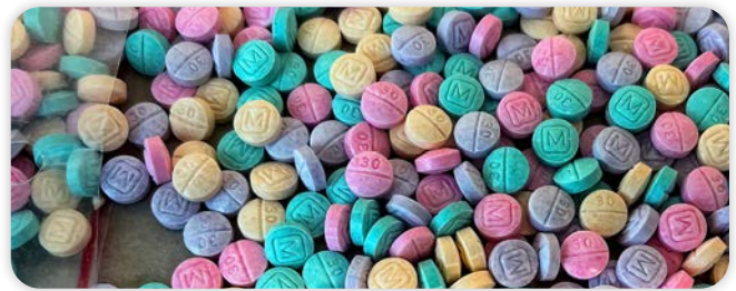
*Pastillas arcoíris FALSIFICADAS de oxycodona M30 que contienen fentanilo