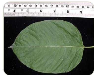
Hoja de árbol de kratom