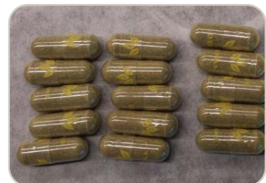
Cápsulas de kratom